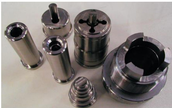
Präzisionsteile aus der PRES BLOCK Fertigung

Die Technik-Abteilung von Pres Block entwickelt Teile/Formen und programmiert den NC-Code für die eigenen CNC-Maschinen, welche über Nacht ohne Bediener fertigen. Eine exakte Arbeitsvorbereitung ist folglich entscheidend um Fehler oder auch Kollisionen zu vermeiden. Dies verlangt genaue Kenntnisse von Werkzeugdaten, Schnittwerten usw.